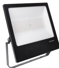
TOTT 2 XL 85W