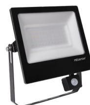
OPTION : Détecteur infrarouge

TOTT 2 par MEGAMAN® est une gamme de projecteurs LED d'extérieur polyvalents conçue pour répondre à plusieurs besoins. L'efficacité lumineuse de la gamme de produits LED s'étend de 103 lm/W à 125 lm/W et de 3000K à 4000K. Un détecteur optionnel de mouvement infrarouge et de luminosité s'adapte sur toute la gamme de produits. La performance des LED et le diffuseur permettent un rendement lumineux de haute qualité sans point chaud.