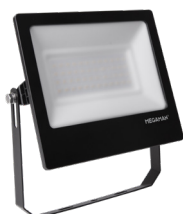
TOTT 2 L 45W