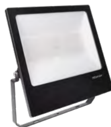
TOTT XL 85W \pm 240^\circ