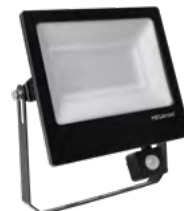
OPTION : Détecteur infrarouge

TOTT par MEGAMAN® est une gamme de projecteurs LED d'extérieur polyvalents conçue pour répondre à plusieurs besoins. L'efficacité lumineuse de la gamme de produits LED s'étend de 103 lm/W à 125 lm/W et de 3000K à 4000K. Un détecteur optionnel de mouvement infrarouge et de luminosité s'adapte sur toute la gamme de produits. La performance des LED et le diffuseur permettent un rendement lumineux de haute qualité sans point chaud.