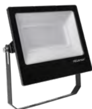
TOTT L 45W \pm 240^\circ